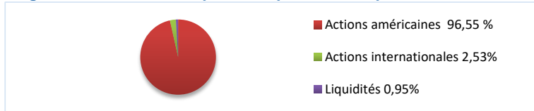
Diagramme circulaire indiquant la répartition des placements

Le tableau ci-dessous indique le rendement du fonds, sur base annuelle, au cours de chacune des 10 dernières années. On remarque qu'au cours de cette période, le fonds a réalisé un rendement positif pendant 9 ans et un rendement négatif pendant 1 an.