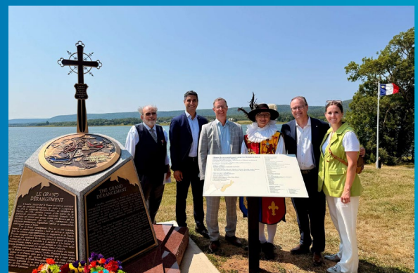
Commanditaire du 19 e monument de l'Odyssée acadienne à Annapolis Royal.