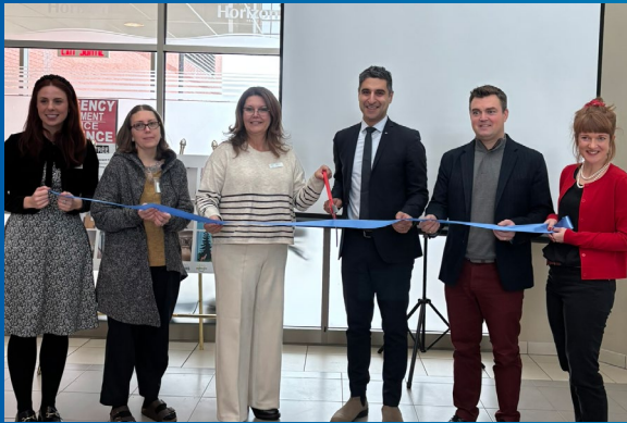
Premier espace SmileZone au Nouveau-Brunswick, à l'Hôpital de Moncton.