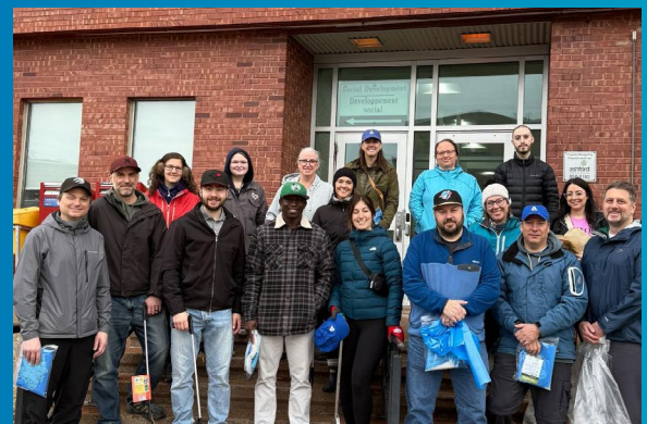
Ramassage de déchets lors du Jour de la Terre par nos équipes.