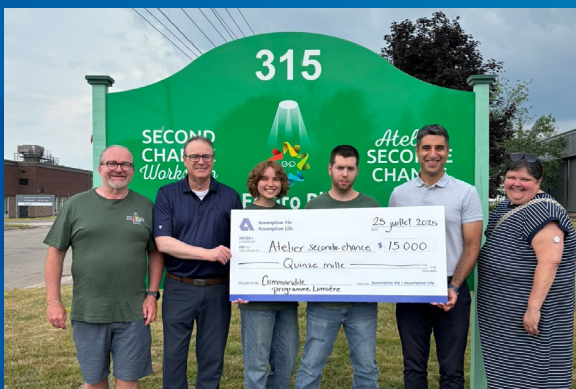
Appui au programme Lumière de l'Atelier Seconde Chance.