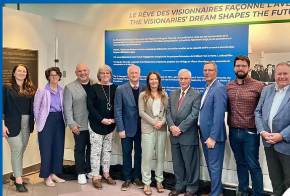
Appui au 50 e anniversaire du CHU D r -Georges-L.-Dumont.