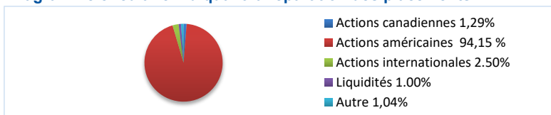
Diagramme circulaire indiquant la répartition des placements

Le tableau ci-dessous indique le rendement du fonds, sur base annuelle, au cours de chacune des 10 dernières années. On remarque qu'au cours de cette période, le fonds a réalisé un rendement positif pendant 8 ans et un rendement négatif pendant 2 ans.